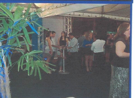
Participação em Eventos