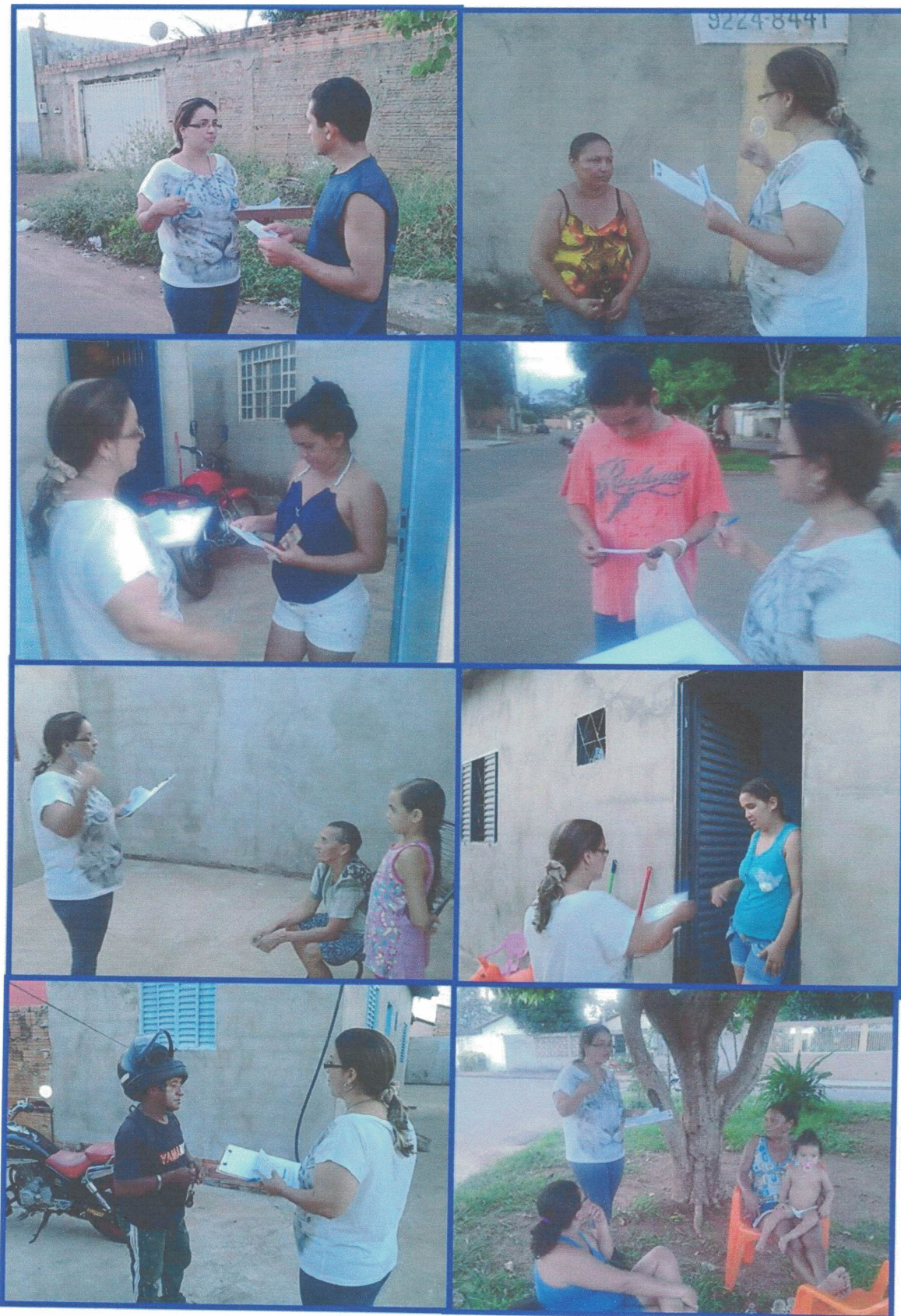
Participação em Eventos